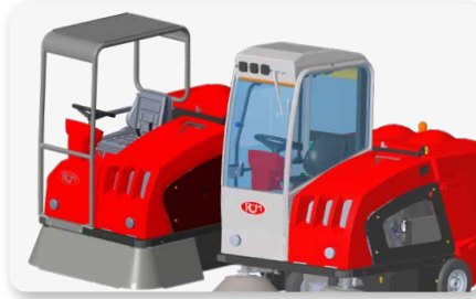
Tettuccio e cabina Canopy and cabin Techo y cabina