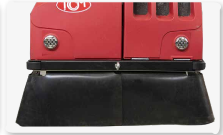
Convogliatore polvere Dust conveyor Encaminador de polvo