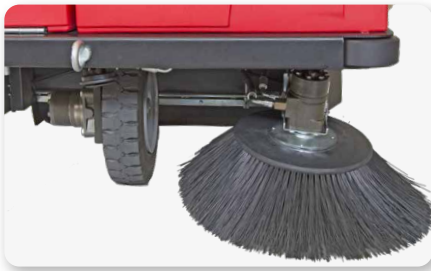
Braccio spazzola laterale sinistro Left side brush arm Brazo de cepillo lateral izquierdo