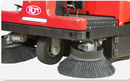
Braccio spazzola laterale sinistro Left side brush arm Brazo lateral izquierda