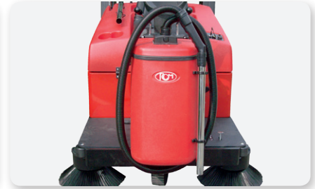
Aspirapolvere Vacuum cleaner Aspiradora